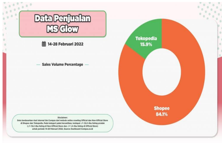
Gambar 1.1 Penjualan Produk Ms Glow skincare periode 14-28 Februari 2022

Kotler & Keller (2012) menyatakan bahwa loyalitas pelanggan merupakan situasi dimana pelanggan secara konsisten membelanjakan seluruh anggaran yang ada untuk membeli produk dari penjual yang sama [1]. Literatur sebelumnya telah banyak meneliti tentang beberapa variabel yang berpengaruh terhadap kepuasan pelanggan seperti yang dilakukan oleh [2], [3], [4], [5], [6], [7], [8]. Beberapa faktor tersebut diantaranya adalah kualitas pelayanan, harga, faktor emosional, promosi, digital marketing , customer relationship marketing , dan lokasi. Dari beberapa faktor tersebut, dalam penelitian ini akan dikaji lebih lanjut tentang pengaruh kualitas produk, digital marketing , harga dan packaging terhadap loyalitas konsumen.